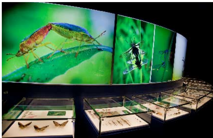
Section « Les as de la reproduction ».

géant de la forêt de Malaisie ( Phobaeticus serratipes ), ainsi que l'un des plus beaux et rares Coléoptères ( Phalacrognathus muelleri ), un Lucanidé exclusif à l'Australie, protégé par l'Annexe 1 de la CITES.