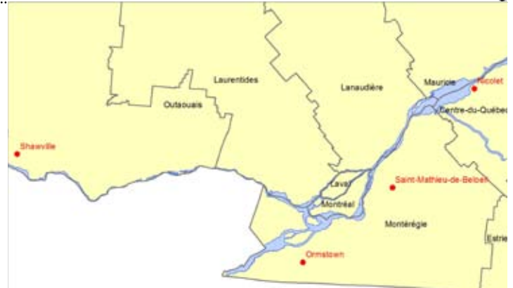
Figure 1 : Sites de captures d'adultes du vers-gris occidental des haricots en 2009

En Ontario, quelques papillons ont été détectés en 2008 et des traces de dommages causés par les larves ont été observées en 2009. Aucune perte économique n'a toutefois encore été observée. Dans l'état du Michigan où cet insecte est présent depuis un peu plus longtemps (2 ans), des niveaux d'infes-