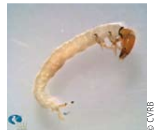
Larve de Philopotamidae, Trichoptère

Les organismes formant le benthos sont particulièrement sensibles aux changements de nature chimique et physique de leur habitat. La pollution organique ou une augmentation en apport de sédiments peuvent provoquer une modification dans la composition et le ratio des espèces de la communauté benthique. De plus, comme ces organismes sont reconnus pour être non mobiles ou sédentaires, on estime qu'il existe une forte relation entre la qualité de l'habitat et la composition de la communauté benthique. Le benthos est donc un excellent bio-indicateur de la qualité du milieu.