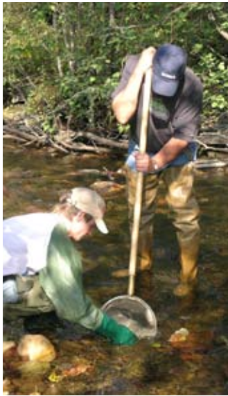
Récolte du benthos

Dans le contexte de ce programme, l'entomologie rend un grand service à l'environnement. En effet, le programme intitulé « SurVol Benthos » permet