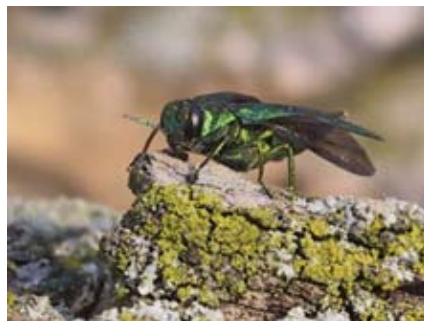
Photo 1. Agrile du frêne, adulte.

L'agrile du frêne est un petit insecte; il atteint, au stade adulte, une taille variant de 8,5 à 14 mm de longueur. Son corps étroit et allongé est bleu-vert métallique, ses yeux sont de couleur bronze (Photo 1). Les larves, blanc crème avec une tête brune, atteignent une longueur de 26 à 32 mm à maturité.