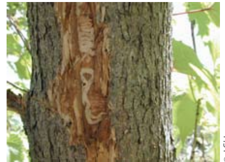
Photo 2. Galeries creusées par l'agrile du frêne.

se nourrir du phloème. Elles creusent des galeries en forme de méandre qui affectent le transport des substances nutritives des feuilles aux racines (Photo 2).