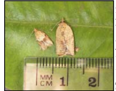
Figure 2. Adultes mâle (gauche) et femelle (droite) de la pyrale brun pâle de la pomme.

Compte tenu de sa récente détection en Amérique du Nord, la biologie de la pyrale brun pâle de la pomme sur notre continent est encore mal connue. Dans les zones