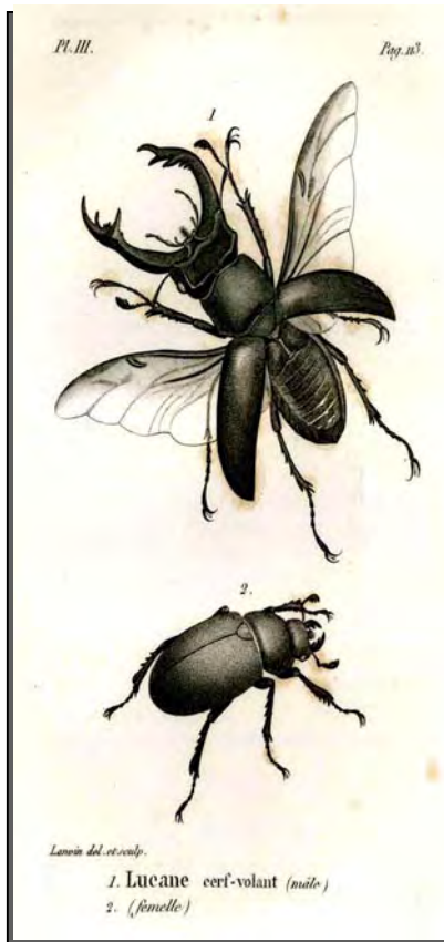
Figure 2. Planche III du premier tome illustrant les Lucanes.